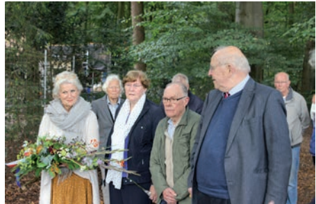
Bestuursleden en directe nabestaanden bij de gedenkplek aan de Joppelaan in Gorssel