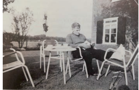
Bij ziekte of ongeval kan de boer toch niet de voeten dankzij de bedrijfsverzorging.