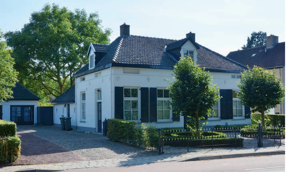
Lochemseweg 40 in Epse. Links zat de melkboer en rechts de groenteboer

kant van het huis. Rechts zit de groenteboer. In het achterste gedeelte van het huis wordt een verkooplokaal ingericht, grote gevulde waterkoelbakken voor de melkbussen en een spoelvoorziening. Het gezin leeft in de woonkeuken naast het verkooplokaal. De mooie kamer aan de voorkant van het huis wordt alleen gebruikt op zon- en feestdagen. Boven zijn drie slaapkamers, waar je tegen de dakspanten aankijkt.