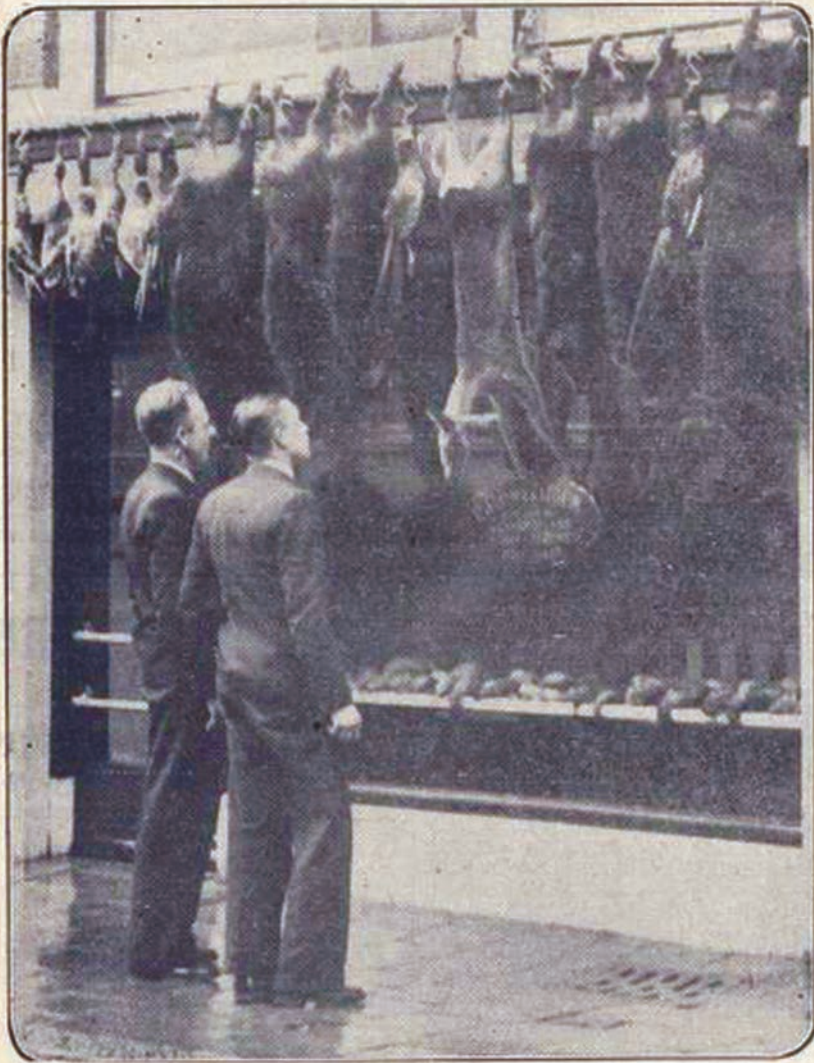
Een Haagsche poelier heeft voor zijn winkel de jachtbuit uitgestald, welke Prins Bernhard op de deze week bij Gorssel gehouden jacht geschoten heeft.

Nieuwe Apeldoornsche Courant 7 november 1936