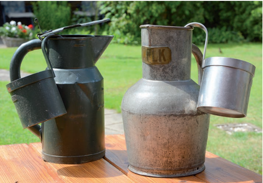
Melkkannen en litermaten