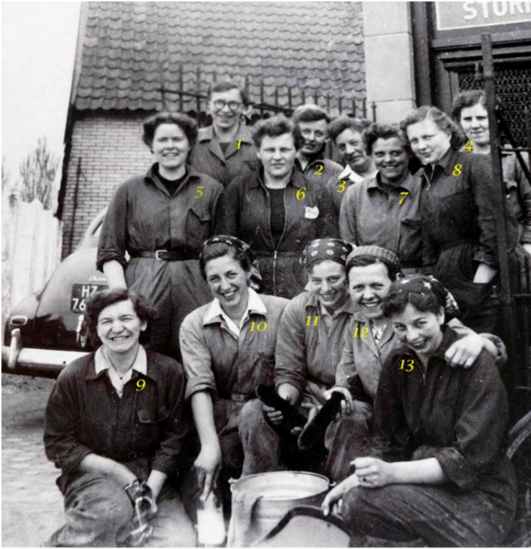
Schoonmaakploeg uit gemeente Gorssel, die na de watersnood-ramp in 1953 hielp met het schoonmaken van Bruinisse