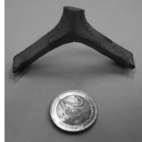
Porseleinen staafje

Vroeger gebruik Tramstation: Bij tuinwerkzaamheden rond het Tramstation is een porseleinen staafje gevonden (zie foto). Uit de overlevering weten we dat kort na de oorlog de heer Mayer het Tramstation gehuurd had en daar ingevoerde materialen in opsloeg. Wie weet iets meer over deze porseleinen staafjes en waar dienden ze voor? En waarvoor gebruikten de kinderen deze staafjes? Ook andere verhalen zijn nog steeds welkom voor het boekje over het Tramstation.