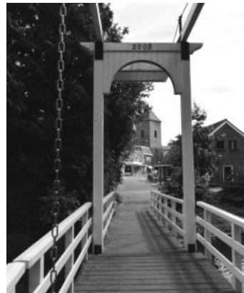
Een doorkijkje in Borculo

Na een interessante wandeling, waarbij we uitgebreide informatie kregen, eindigden we onze tocht bij de synagoge. Onder beheer van de Stichting Synagoge Borculo is in dit fraai gerestaureerde gebouw sinds oktober 2011 het educatief Joods Museum gevestigd. Een bezoek aan deze synagoge is een aanrader. Tijdens ons verblijf hier werden we verrast door een optreden van een sopraan, die onder begeleiding van een organist het Ave Maria van Schubert zong. Dit gaf toch wel een bijzonder slot aan een prachtige middag.