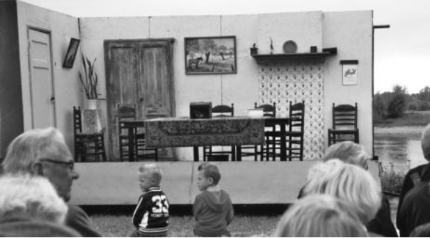
Theateruitvoering De Erfgenamen

Tijdens dit door de Stichting IJsselhoeven georganiseerde evenement konden de deelnemers aan de theatertocht het boekje Erfgenamen kopen. In dit boekje, voorzien van prachtige foto's, vertellen de bewoners iets over hun huis en hun omgeving. Het boekje is nog verkrijgbaar bij de molen in de Eesterhoek, bij bloemisterij Edelweiss en bij kantoorboekhandel Bechtle en kost € 6,00.