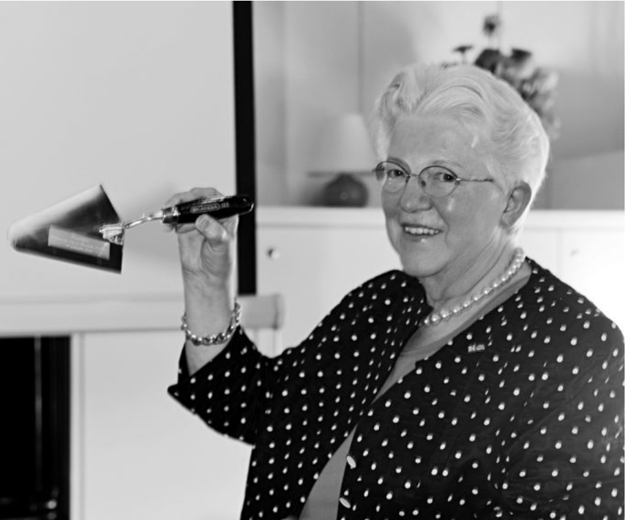
De verzilverde troffel