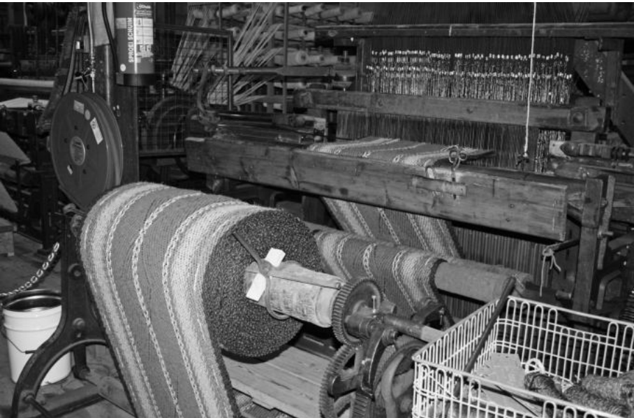
Het maken van tapijten met een tuftingmachine

Na de film konden we op de eerste etage een aantal handweefgetouwen aan het werk zien en op de begane grond de verschillende soorten geautomatiseerde weefgetouwen. Op de eerste geautomatiseerde weefgetouwen konden nog geen tapijten met patronen gemaakt worden en deze produceerden 80 tot 100 cm tapijt per dag. Op de latere weefgetouwen kon men ook patronen inweven, zelfs tot jacquardpatronen, via ponsbanden, toe. Tegenwoordig worden de tapijten gemaakt met tufting machines. Deze machines lijken wat op een naaimachine. De tapijten worden met ca. 1500 naaldjes 'genaaid', per machine zo'n vier km per dag. De achterkant van de tapijten moet dan wel met een soort plaklaag afgewerkt worden.