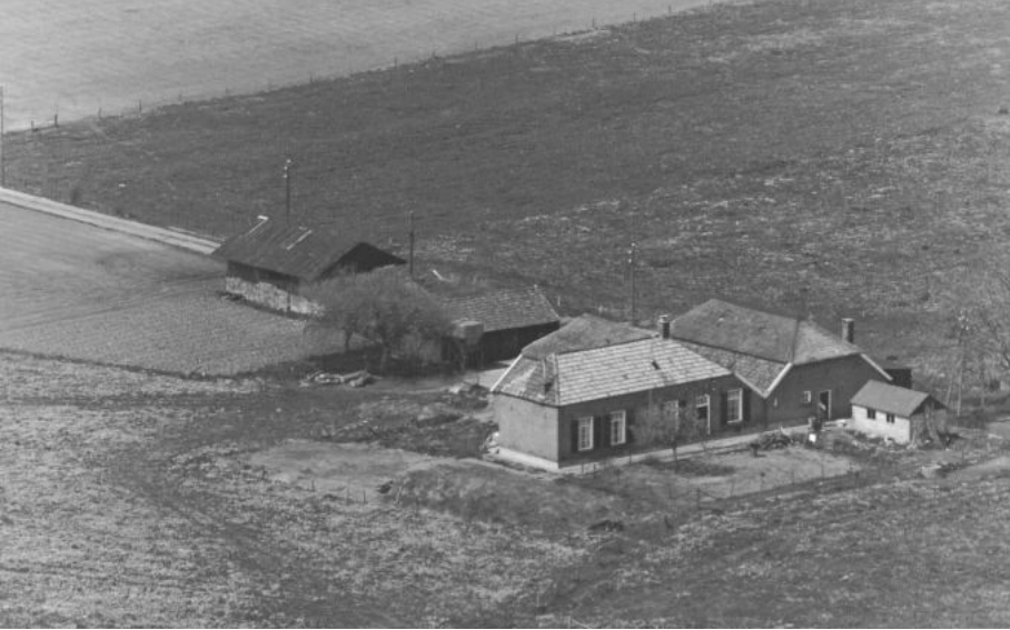
De Moespot in vogelvlucht