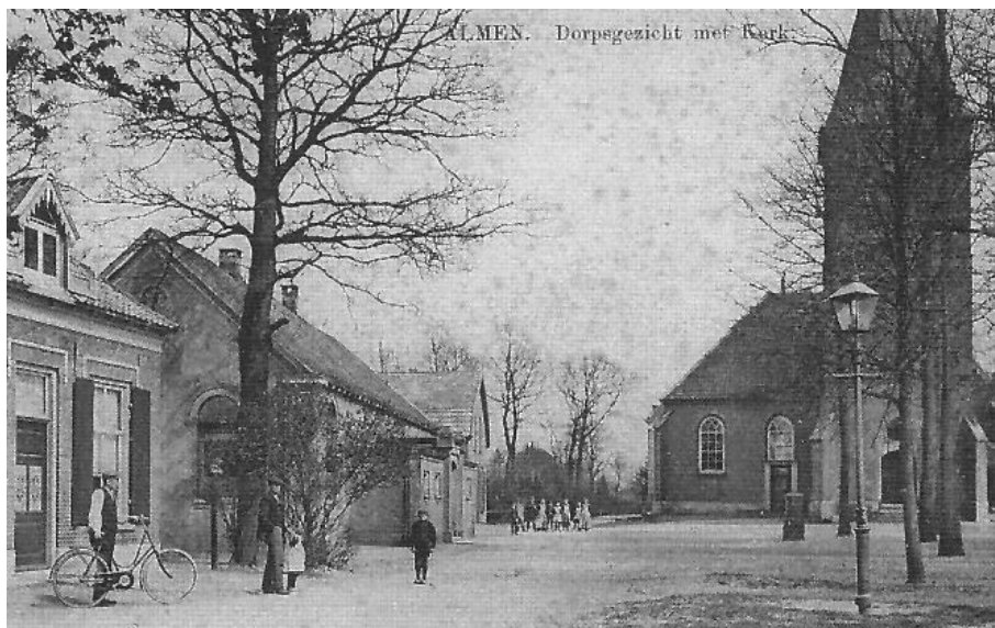
Dorpsgezicht Almaen ca. 1912

In de consistoriekamer hangen twee afbeeldingen van huis Ter Meulen, dat in 1874 is afgebroken. Aan de Berkelweg naar het zwembad herinnert het witte tuinmanshuis uit 1824 nog aan het vroegere kasteeltje. De hier tegenover gelegen kolk is het restant van de grachten rondom huis Ter Meulen, die in verbinding stonden met de Berkel.