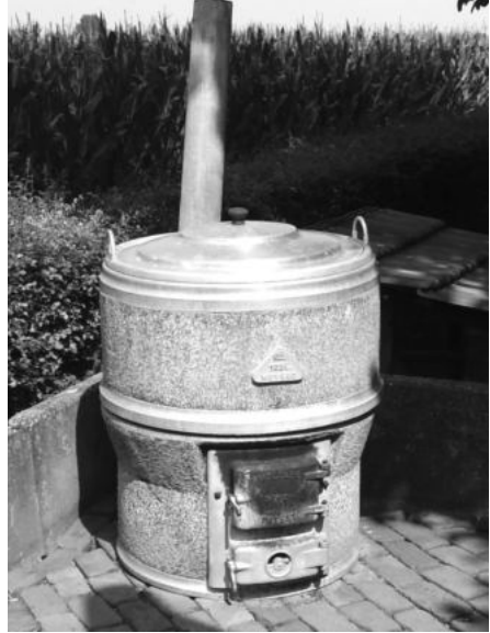
Fornuispot / moespot