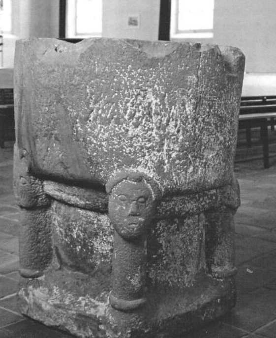
Het zandstenen doopvont