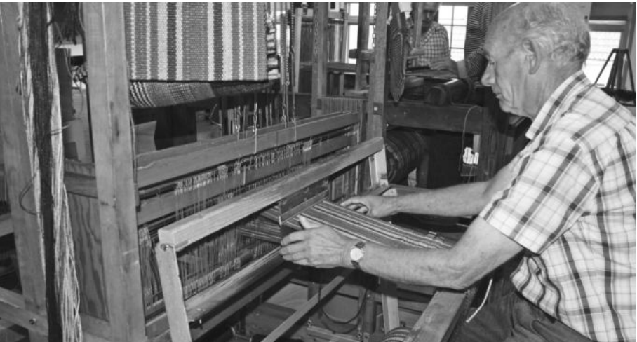
Werken aan een handweefgetouw

Om ca. 10.00 uur waren we in Genemuiden, waar we even moesten zoeken naar het Tapijtmuseum. Daardoor reden we een rondje door het centrum van Genemuiden met zeer smalle straatjes. In het Tapijtmuseum werden we ontvangen met koffie en gebak. De meneer van het museum was wel een beetje teleurgesteld dat bij onze groep geen mensen in klederdracht waren: we kwamen toch uit Marken? Hij kwam er al snel achter dat dit een groep was van de Historische Vereniging De Elf Marken uit Gorssel. Tijdens de koffie werd er een zeer informatieve film getoond getiteld 'Van Biezen tot Kunstgras'. Hierin werd verteld dat Genemuiden 60% van de tapijtfabricage in handen heeft.