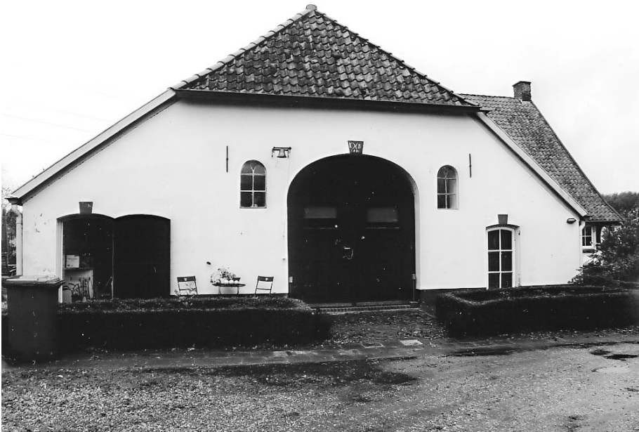
Het oudste gedeelte van Het Muldershuis

De woning maakte eertijds deel uit van de Eefsche windmolen. Niet duidelijk is waar toen de molen heeft gestaan. Vermoedelijk is het de molen die later bekend stond als de 'molen van Lok'.