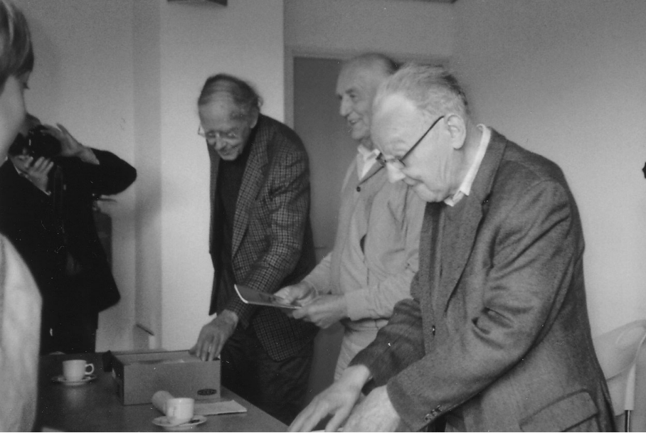
Aanbieding boek (uitreiking van het boekje Eefde in bange dagen)

Eefde in de oorlog. Om dat te bevorderen hebben de kinderen van de vier hoogste groepen van beide Eefdense scholen dit boekje gratis gekregen.