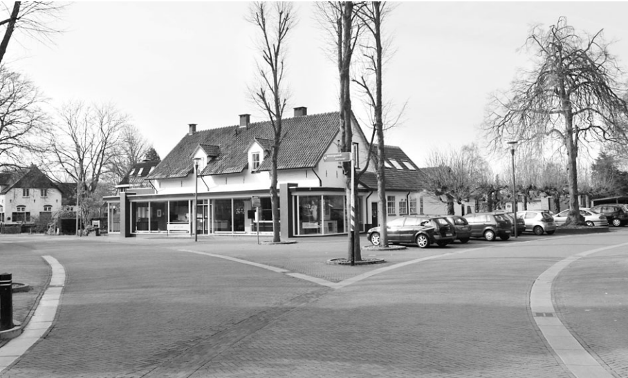
Huidige Keukenstudio Stormink