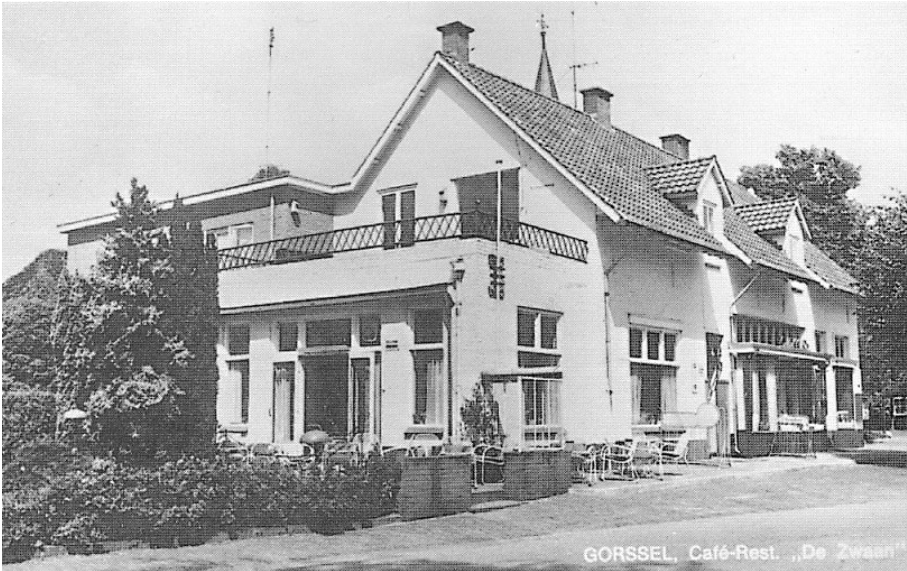
Bakkerij Wesseldijk, voorheen Dijkers en café en slijterij De Zwaan

Johannes Dijkers was aanvankelijk administrateur van beroep, maar heeft toen de in het pand nog beschikbare ruimte verbouwd. Hij liet ook een aantal hotelkamers bouwen en toen werd het Hotel Café Restaurant De Zwaan. Tijdens deze verbouwing stuitte men nog op overblijfselen van een gelagkamer uit het verre verleden. Hiermee ontstond een nieuw bedrijf in Gorssel, dat veel klandizie kreeg. Dit bedrijf heeft tot ongeveer 1979 goede zaken gedaan, maar omdat geen van de twee kinderen belangstelling had om het bedrijf voort te zetten werd besloten om het te verkopen.