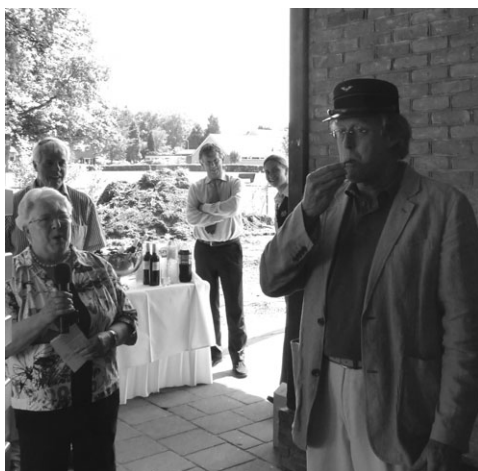
Startsein door 'chef' Platell