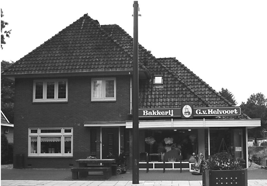
Huidige bakkerij van Helvoort

Momenteel heeft bakkerij Van Helvoort ongeveer zes personeelsleden in dienst om het bedrijf te kunnen runnen. In het voorjaar van 2009 is de winkelinrichting totaal vernieuwd volgens de laatste inzichten.