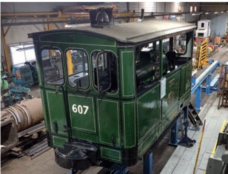
De 'Vrijland' in de werkplaats ter voorbereiding van de restauratie.

* De locomotief is genoemd naar de burgemeester van Hummelo en Keppel (van 1883 tot 1920) Cornelis Wilhelmus Vrijland II (1845-1928).