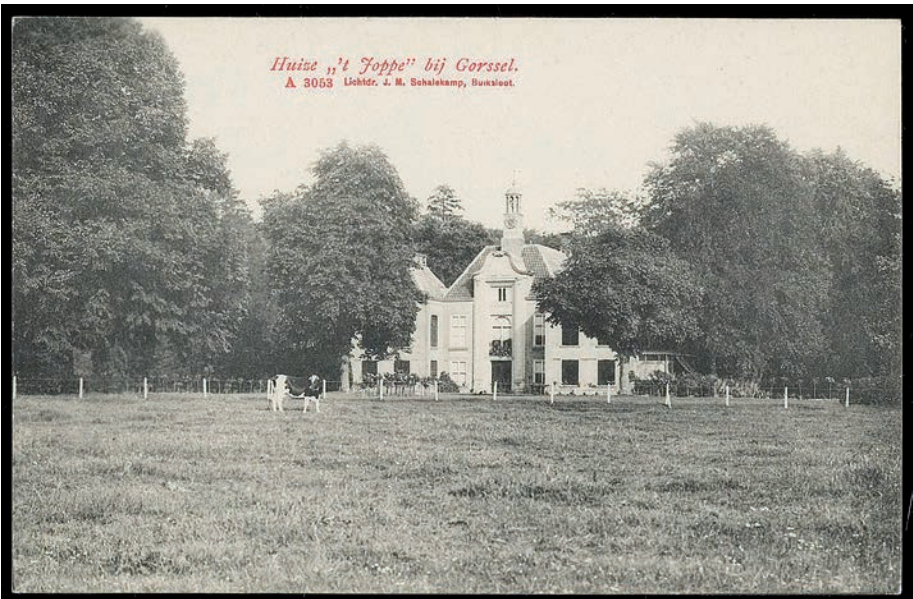
Huize 't Joppe rond 1900