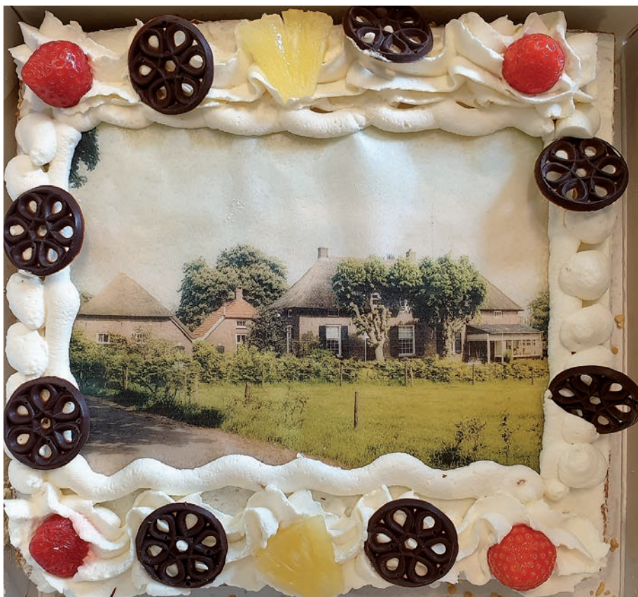
De werkgroep genealogie kreeg een taart aangeboden van de familie Roeterdink