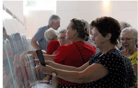
'Controle' van de uitgewerkte tekening