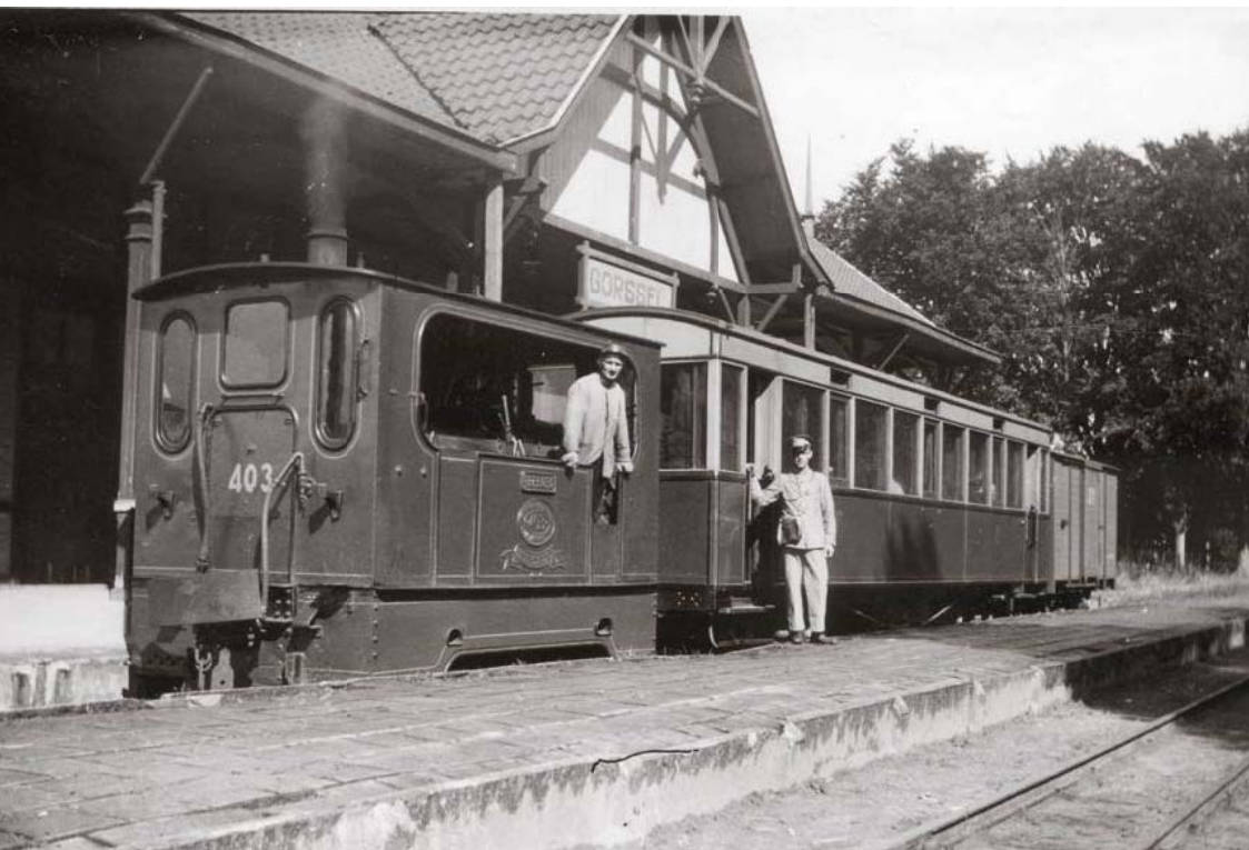
Het tramstation vanaf 1926