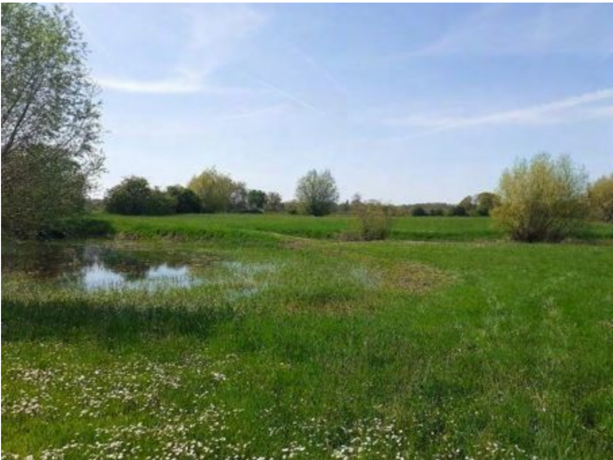
Ravenswaarden, een prachtig landschap