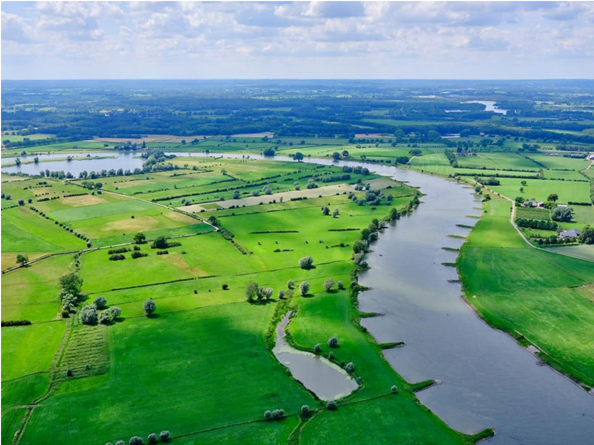
'Birdsview' van de IJssel en een deel van de Ravenswaarden