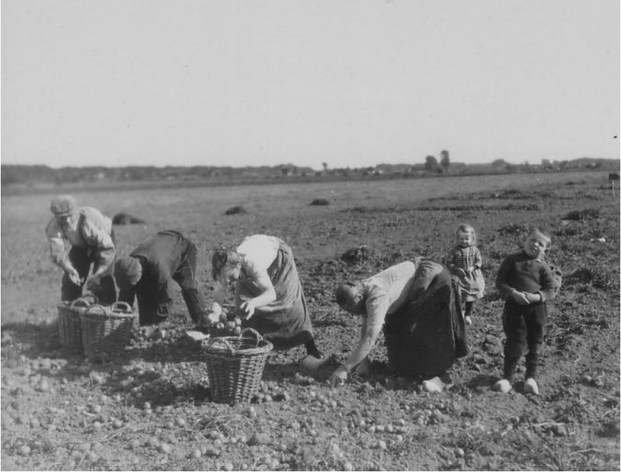
Aardappeloogst aan de Kletterstraat. Het hele gezin helpt mee.