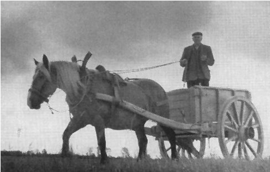
Het gebruik van de stortkar voor de kleinere klussen.

Elke week ging de boer met paard en kar naar de plaatselijke molenaar of landbouwcoöperatie om graan te laten malen en meteen voer mee te brengen voor de koeien, varkens en kippen en zo nodig ook kunstmeststoffen.