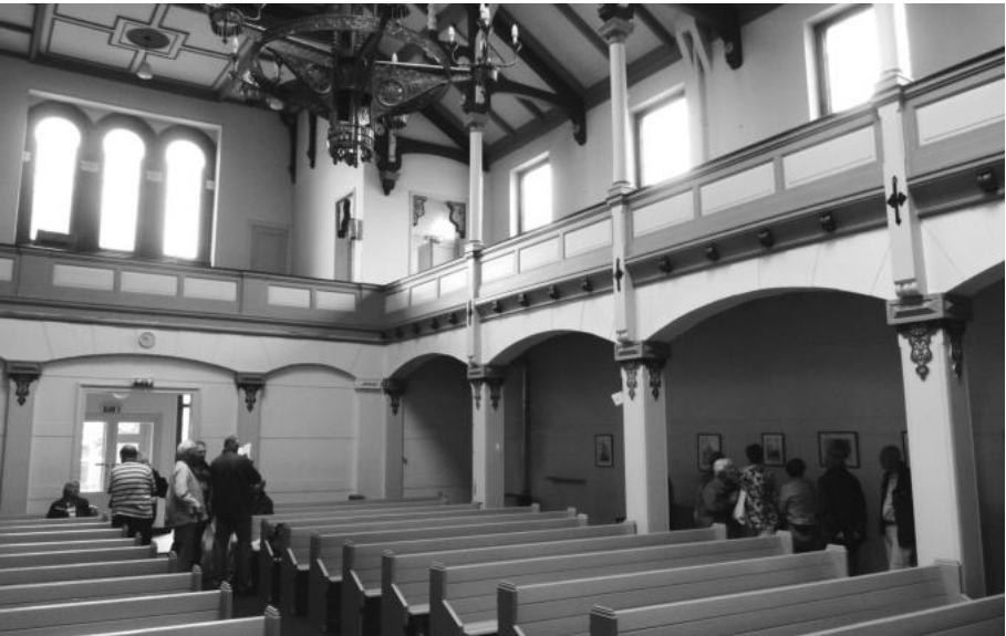
Het interieur van de synagoge.

Na een korte wandeling, die door alle verhalen toch ruim een half uur duurde, kwamen we bij de synagoge in de Golstraat. Deze synagoge, die in 1892 door de Deventer architect Mulock Houwer werd gebouwd, wordt sinds kort gehuurd door het Etty Hillesum Centrum. Zij wordt gebruikt voor het houden van lezingen en presentaties. Voor 1892 werd, vanaf 1799, het gebouw in de Roggestraat gebruikt als synagoge, nu is daar het Etty Hillesum Centrum gevestigd. Daarvoor was het de Joodse school en daarna was het het onderkomen voor het Filmhuis, nu te vinden naast de Schouwburg.