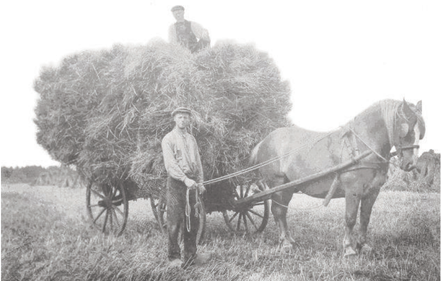
Het binnenhalen van de rogge.