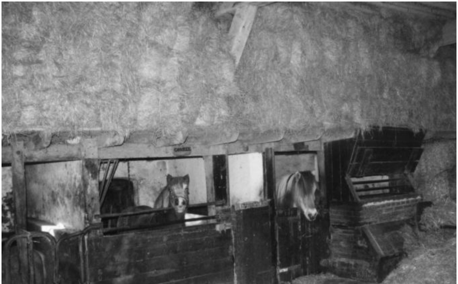
De paardenstal met hakselkist.