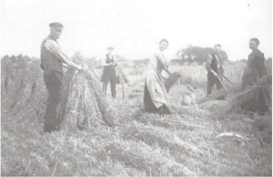
Hier worden de garven aan gasten gezet.