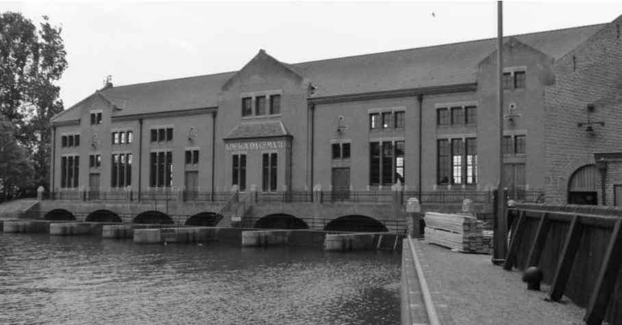
E1 Het gemaal te Lemmer.

We vertrokken op tijd met een luxe bus naar Lemmer, waar we het ir. D.F. Woudagemaal hebben bezichtigd. Het gemaal uit 1920 is het grootste nog werkende stoomgemaal ter wereld en staat op de Werelderfgoedlijst. Het gemaal dient om het waterpeil van Friesland op peil te houden. Bij aankomst kregen we in het nieuwe, op 1 september 2011 geopende, bezoekerscentrum een ca. tien minuten durend filmpje over het opstarten van het gemaal. Na de film konden we koffie drinken in het restaurant van het bezoekerscentrum en daarna was er een rondleiding door het gemaal. Helaas was het gemaal nu niet in bedrijf, wel werd net een van de ketels opgestart, maar toen wij weer weggingen was de druk nog te laag om het gemaal in werking te zien.