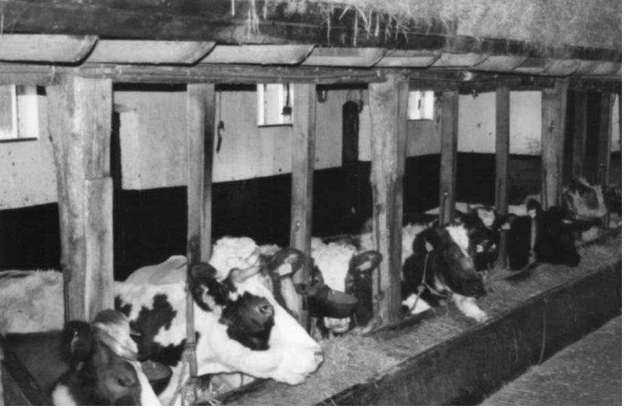
De koeien op de deel.