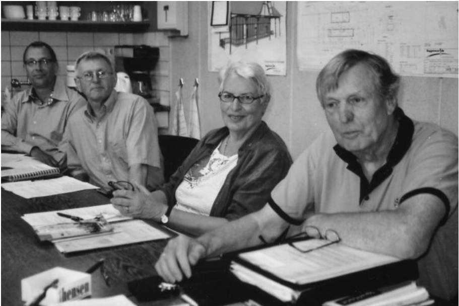
De laatste bestuursvergadering in Harfsen.

Maar nu eerst alle aandacht voor de opening voor genodigden op 28 oktober en op de dag erna ons Open Huis... feestelijke gebeurtenissen die al achter de rug zijn als u dit leest.