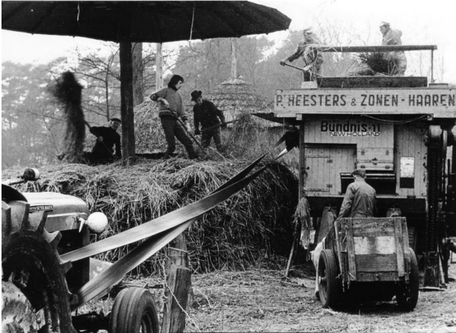
Dorsen bij de familie Pasman aan de Harfsensesteeg.

Als het een aantal maanden wat minder druk was, werd het tijd om de granen die in de zomer waren geogst en opgeslagen, te gaan dorsen. De dorsmachine kwam dan van boer tot boer om het graan te dorsen en dit gebeurde twee à drie keer gedurende de wintermaanden.