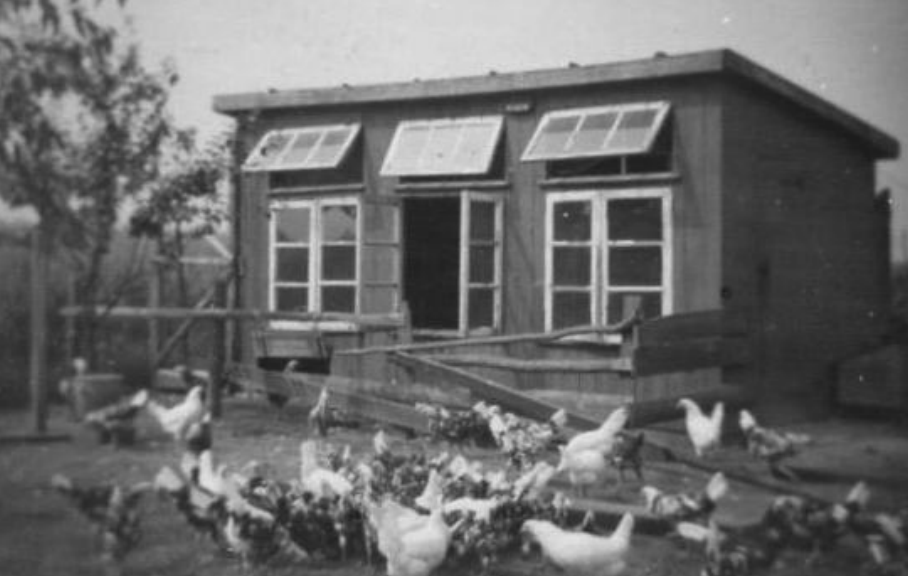
Kippenhok van de familie Woertman aan de Kapelweg.

Al spoedig werd de verlichting van de fietslamp verzorgd door een dynamo. Door de dynamo op het achterwiel te monteren en de fiets op een standaard te zetten kon men door te fietsen ook de kamer, de deel of de stal verlichten. Ook hadden sommige mensen een knijpkat - een soort zaklantaarn die werkte volgens het dynamo-principe. Een handige oplossing als men 's avonds in het donker op pad moest om de weg te vinden. Al snel daarna kreeg men gas in flessen waarmee een betere verlichting en koken op gas mogelijk werden. Voor de verlichting van de kippenhokken maakte men gebruik van speciale petroleumlampen die de petroleum vergasten (petromaxlamp genoemd). Deze lampen gaven een heel fel licht. Dit verlichten van de kippen was nodig, want een kip heeft veertien uur licht nodig om ook in de wintermaanden constant eieren te kunnen produceren.