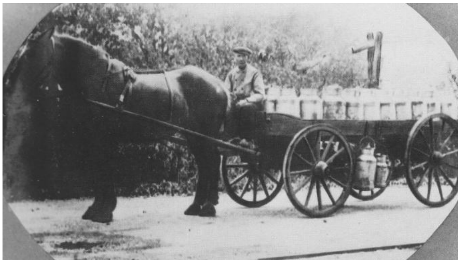
Oude melkrijder G. Schutte (Braoker Gait) in ± 1920.

Men stond 's morgens op om ongeveer 5.30 uur en begon met het melken van de koeien, want de melk moest op tijd in melkbussen aan de weg staan als de melkrijder langs kwam om die naar de melkfabriek te brengen. De melkrijder bracht ondermelk mee terug. Deze melk was bijzonder geschikt om, gemengd met rogge-meel tot brij, als 'slobber' aan de varkens te voeren.